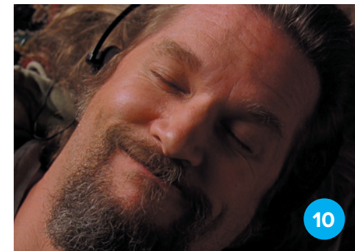
Jeff Bridges (Nagy Lebowskij)

Ha nem tudunk fizikailag elutazni, utazzunk el lelkileg és szellemileg: olvassunk könyveket! Inspiráció extra: adjunk ki mi könyvet, egyedül vagy barátokkal kalákában! Az elmúlt évek egyik leginspirálóbb élménye volt, amikor kiadtuk Eszter barátunknak a Fűszer és Lélek gasztroblogkönyvet.