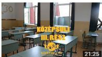
KÖZÉPSULI sorozat - 3. rész [KÖZÉPSULI TV] 740 821 megtekintés • 1 éve