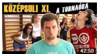
KÖZÉPSULI sorozat - 11. rész [KÖZÉPSULI TV] 721 468 megtekintés • 8 hónapja