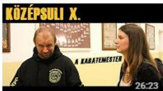
KÖZÉPSULI sorozat - 10. rész [KÖZÉPSULI TV] 589 810 megtekintés • 9 hónapja