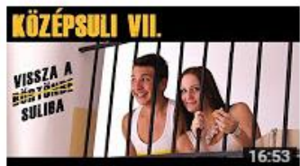
KÖZÉPSULI sorozat - 7. rész [KÖZÉPSULI TV] 630 683 megtekintés • 10 hónapja