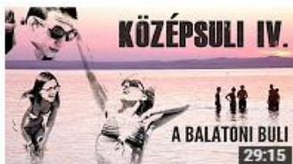
KÖZÉPSULI sorozat - 4. rész [KÖZÉPSULI TV] 824 844 megtekintés • 1 éve