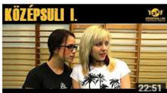
KÖZÉPSULI sorozat - 1. rész [KÖZÉPSULI TV] 1 060 331 megtekintés • 1 éve