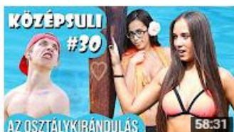
KÖZÉPSULI sorozat - 30. rész [KÖZÉPSULI TV] 713 467 megtekintés • 3 hete