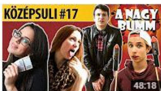
KÖZÉPSULI sorozat - 17. rész [KÖZÉPSULI TV] 645 868 megtekintés • 6 hónapja