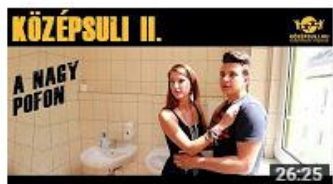
KÖZÉPSULI sorozat - 2. rész [KÖZÉPSULI TV] 1 282 380 megtekintés • 1 éve