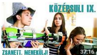
KÖZÉPSULI sorozat - 9. rész [KÖZÉPSULI TV] 715 244 megtekintés • 9 hónapja