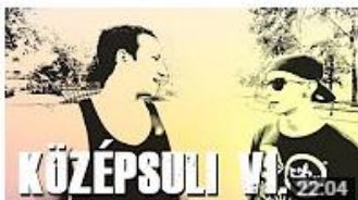
KÖZÉPSULI sorozat - 6. rész [KÖZÉPSULI TV] 600 357 megtekintés • 11 hónapja