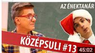
KÖZÉPSULI sorozat - 13. rész [KÖZÉPSULI TV] 593 731 megtekintés • 7 hónapja